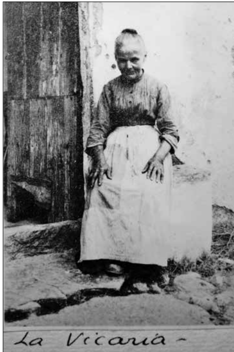
L'àvia Vicària, fotografiada el 1923.

També ens hem de fer a la idea que Sant Sebastià era ben diferent de com el coneixem avui. Si ara els arbres i els boscos pràcticament l'encerclen com un mantell verd i compacte,