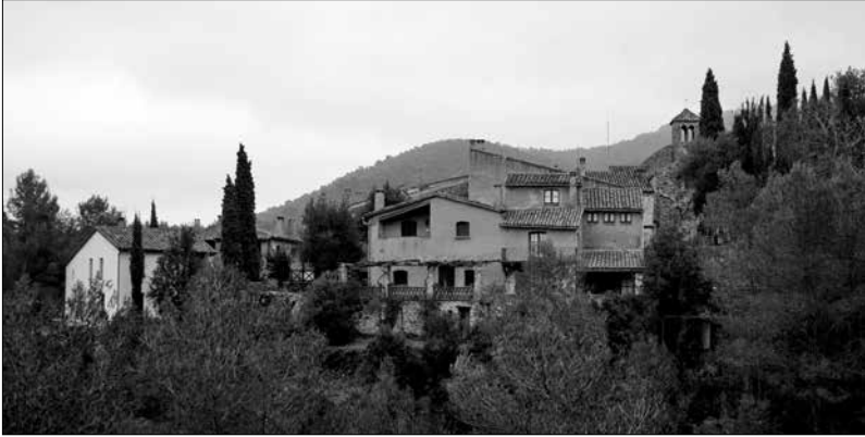
El Serrat de Dalt.