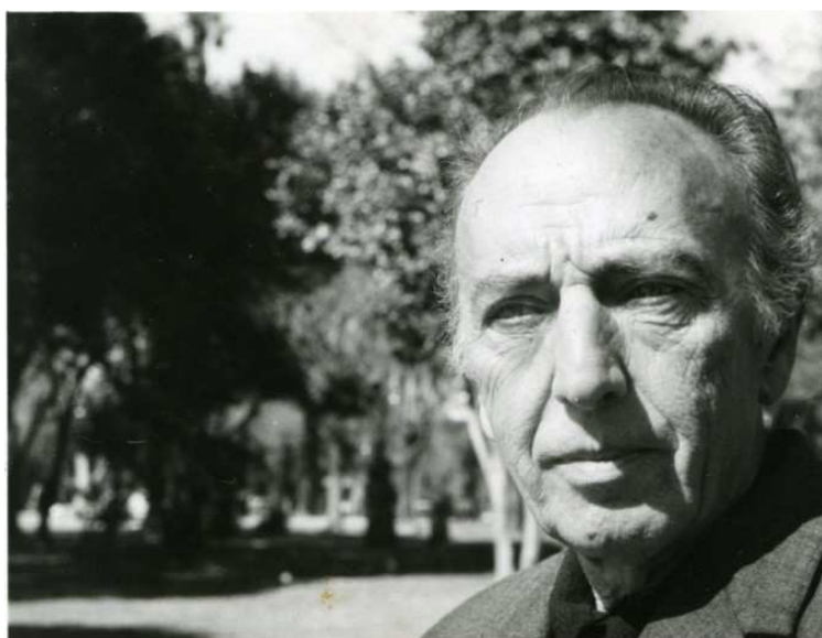
( http://www.nuvol.com/noticies/agusti-bartra-el-cant-per-a-tothom/attachment/agusti-bartra/ )