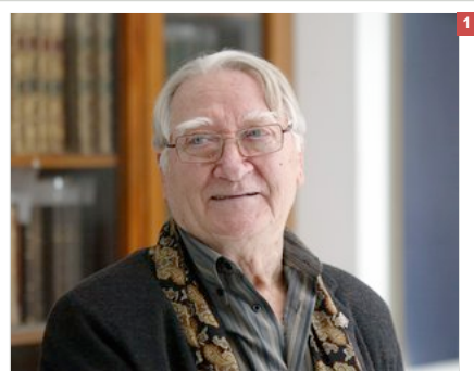
El poeta Màrius Sampere, ahir, a l'Ateneu Barcelonès.

Darrera actualització ( Dijous, 29 d'abril del 2010 02:00 )