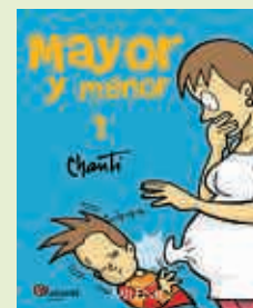
Mayor y menor Chanti