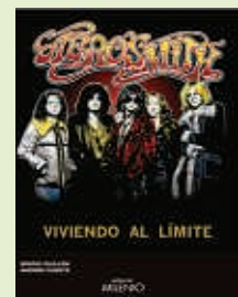
Aerosmith Viviendo al límite Sergio Guillén - Andrés Puente