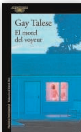
Gay Talese El motel del voyeur Alfaguara