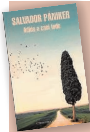
Salvador Pániker Adiós a casi todo Lit. Random House

La vida de Salvador Pániker se apagó el pasado 1 abril, apenas dos días después de que «Adiós a casi todo», la última entrega de sus diarios, saliese a la imprenta. El filósofo y editor no llegó a ver su último libro publicado, pero para la posteridad queda este conjunto de reflexiones azarosamente póstumas con el que Pániker da cuenta de su vida «más íntima», de la realidad del momento social y de su pensamiento filosófico. «Adiós a casi todo», quinto volumen de esta suerte de memorias fragmentadas que