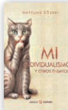
Natsume Soseki Mi individualismo y otros ensayos Satori

Elegante y estilizado maestro del Nuevo Periodismo, Gay Talese ha visto publicado este año su controvertido «El motel del voyeur», un libro en el que explica la historia (aparentemente real) del propietario de un motel de Colorado que construyó una pasarela oculta sobre las habitaciones del establecimiento para espiar escenas íntimas de los visitantes. Una relato de corte periodístico cuya veracidad fue puesta en entredicho y rebajó notablemente las expectativas de un Talese que parece enredarse aquí entre la realidad, la ficción y el exceso de confianza hacia una fuente poco fiable.