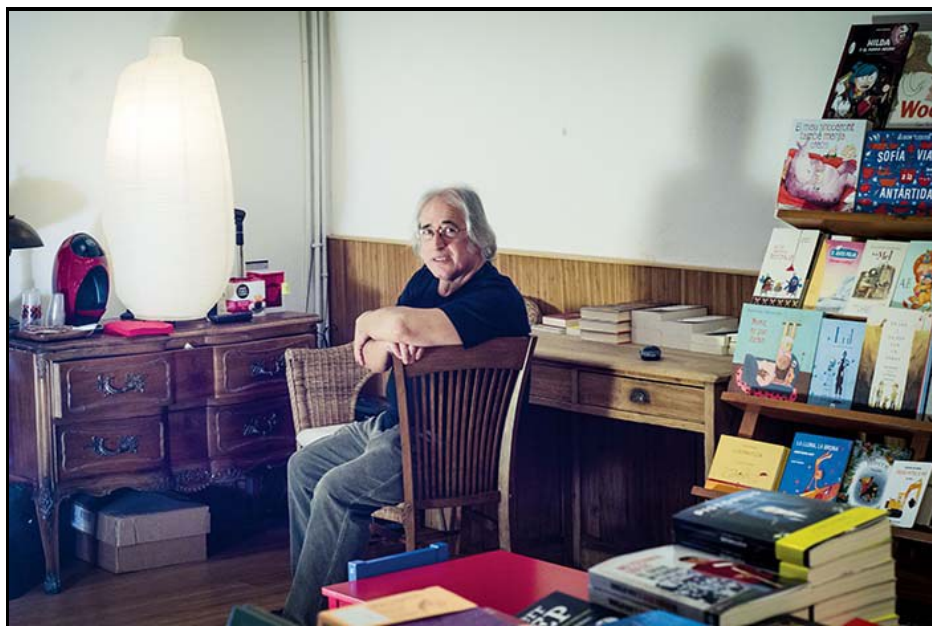
Llibreria Documenta de Barcelona