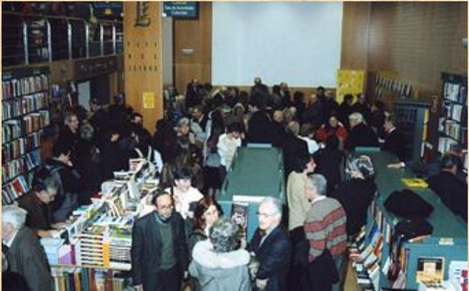
Un públic molt nombrós va assistir a la presentació de Casa del Llibre.