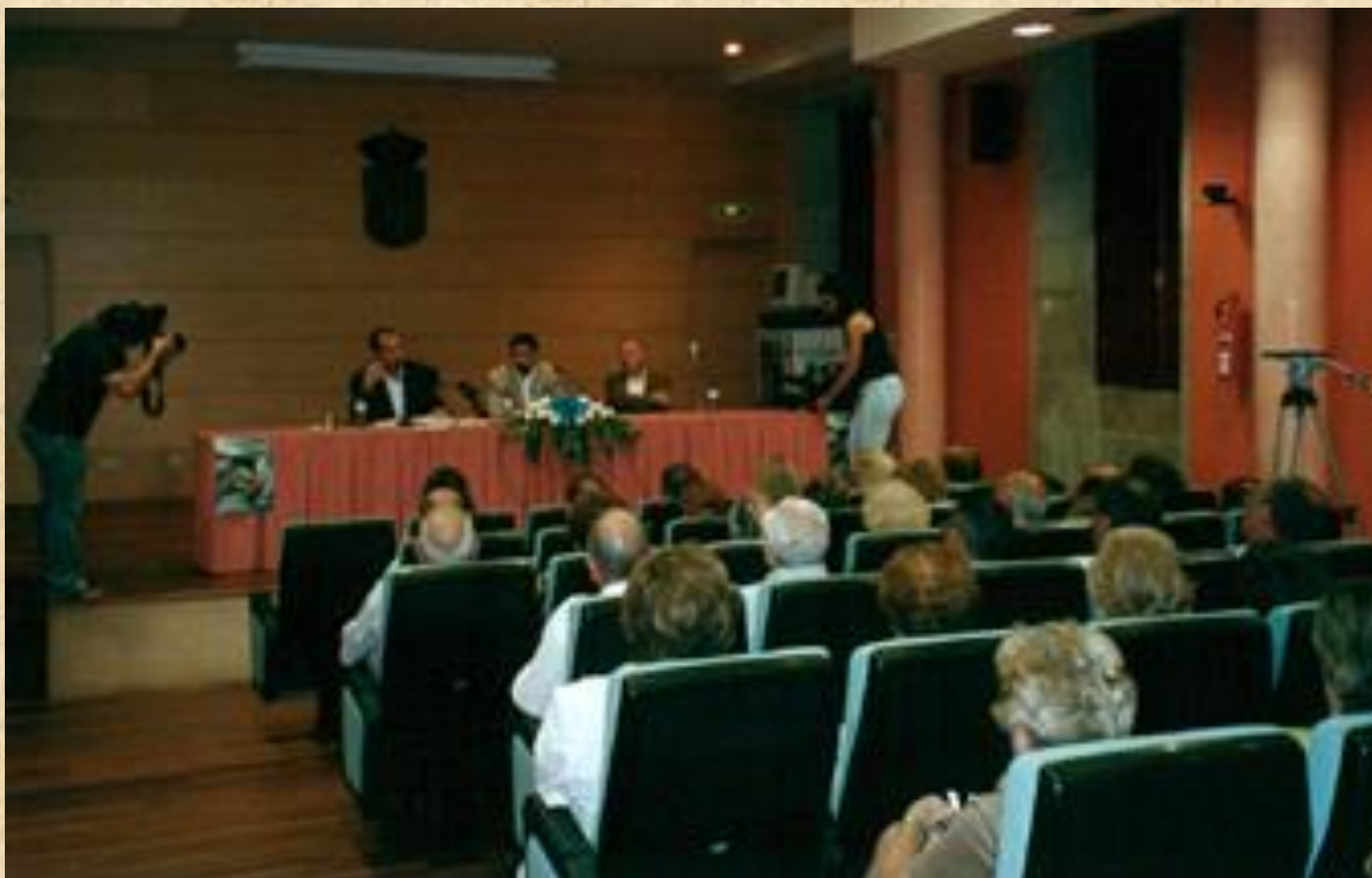
El Concello de Verín acogió la presentación de “Los roedores” ante el público gallego.