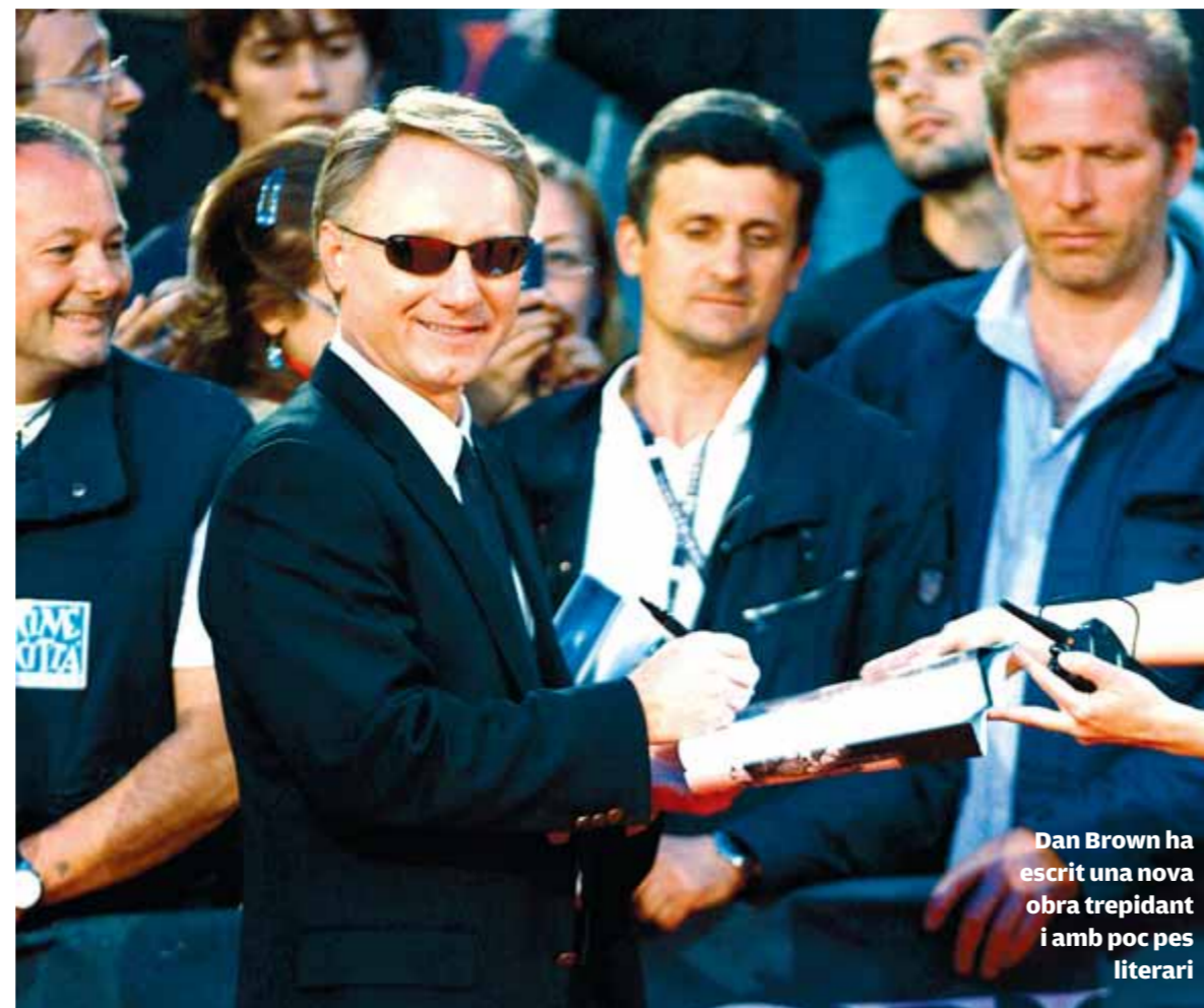
Dan Brown ha escrit una nova obra trepidant i amb poc pes literari

que passarà són els habituals, també hi ha tot de miniconferències incrustades en el text, sobre l’arquitectura de Washington, sobre els símbols maçònics que s’amaguen en els edificis de la capital i, en especial, sobre la doctrina que ara l’autor ens vol vendre (així, part del capítol 107 es dedica a explicar com s’ha de fer per pensar l’ànima humana). Perquè res no alenteixi la velocitat lectora, l’escriptura està desproveïda de tot el que pugui fer nosa. Brown té com a únic procediment narratiu la retransmissió. Retransmet accions, retransmet converses i fins i tot retransmet pensaments. Així, si un personatge,