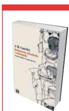
Seductors, il·lustrats i visionaris. Sis personatges en temps adversos