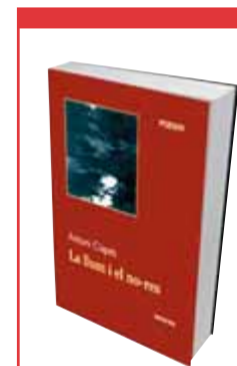
La llum i el no-res

Així les coses, no podria ser més oportú Sala-Valldaura, autor del pròleg, quan remarca que tot esperant trobar una poesia estrictament metapoètica, el que descobrim amb sorpresa en aquest llibre són “emocions i sentiments, una tensió emotiva que prové de la intel·ligència”. I és ben cert que plana sobre l’obra una sensibilitat no del tot desconeguda a qui per ventura hagi freqüentat la poesia oriental. Una sensibilitat per cert amb un nom ben concret: l’expressió japonesa kokoro . Ens ho explica Octavio Paz en algun lloc d’ El signo y el garabato : com si per als japonesos no fos prou sentir només amb el cor, tanquen en un sol mot sensació, pensament i les mateixes entranyes. No costa gens aplaudir, doncs, que també Clapés busqui amb els seus versos una doble commoció, afectiva i intel·lectual, i que per tant ens hagi tornat a confirmar que, tot i des d’una estètica negativa, no es pot negar que es tracta d’un líric generós.*